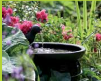
Was den Garten mediterran macht: Wasser ...