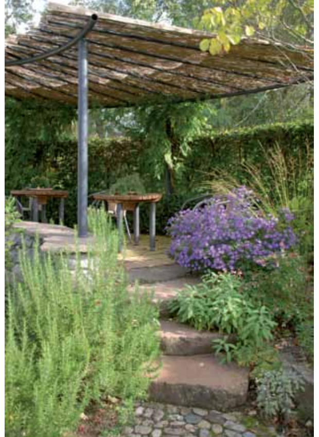
Anmutig: Eine Natursteintreppe, die zum Gartenpavillon führt.

Pflanzen. Im traditionellen Farbensemble aus Safrangelb, Ocker und Rot brechen sie die geometrischen Formen auf. Von hier ist es nicht mehr weit zu einem mediterranen Garten mit natürlich-rustikalem Charakter, der sich durch eine besonders vielfältige Bepflanzung auszeichnet, oder einem Mittelmeergarten modernen Typs. „Weniger ist mehr“ ist hier die Devise: In seiner reduziert ausgeführten Gestaltung fokussiert er auf Swimmingpool, Liegewiese und dezidiert eingesetzte Gehölze.