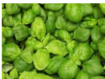
Basilikum Ocimum basilicum

Mediterrane Gärten sind ein Genuss für die Sinne. Die Italienische Strohblume mit ihrem Curry-duft, das Heiligenkraut mit seinem harzigen Aroma, Lavendel, Zitronenverbene, Spanischer Ginster und die aromatischen Öle der Zitrussträucher: Sie alle vermischen sich zu einem Duft-Potpourri, das Erinnerungen an ferne Länder weckt.