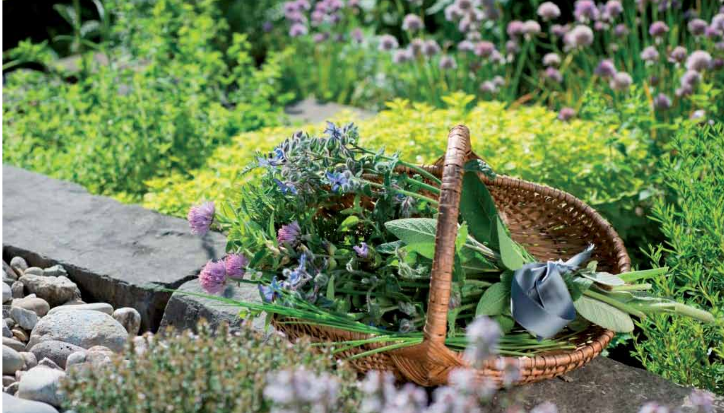
Das Herz eines mediterranen Gartens ist der Kräutergarten.