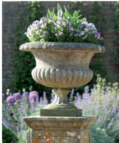
Sorgen für südliches Ambiente: Vasen ...

Bei der Dekoration eines mediterranen Gartens kennt die Phantasie keine Grenzen: Antike Vasen können am Ende eines Laubengangs platziert werden, Engel aus blühenden Arrangements hervorspähen, exklusive Skulpturen einen Hauch von Noblesse verbreiten. Kleine Wasserspiele und Becken aus Marmor, Kalkstein oder Keramikfliesen schaffen ein südliches Ambiente. All dies verzaubert und lässt Ferienstimmung aufkommen - in der eigenen, ganz privaten „Isola Bella“.