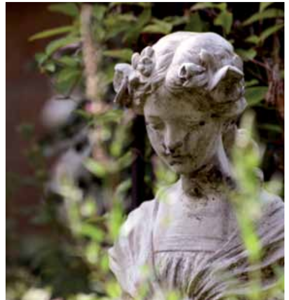
... oder in lauschigen Gartenecken versteckte Büsten.