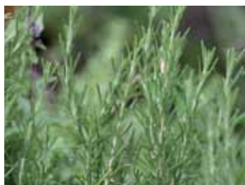
Rosmarin Rosmarinus officinalis