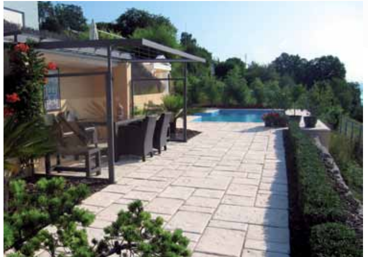
Reduziert, aber stilecht: Südliches Flair mit Pool und Pergola.