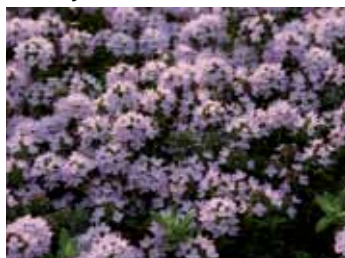
Kaskaden-Thymian Thymus longicaulis subsp. odoratus