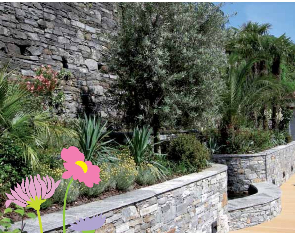
Charakteristisch: traditionelle Baustoffe und viel kräftiges Grün.