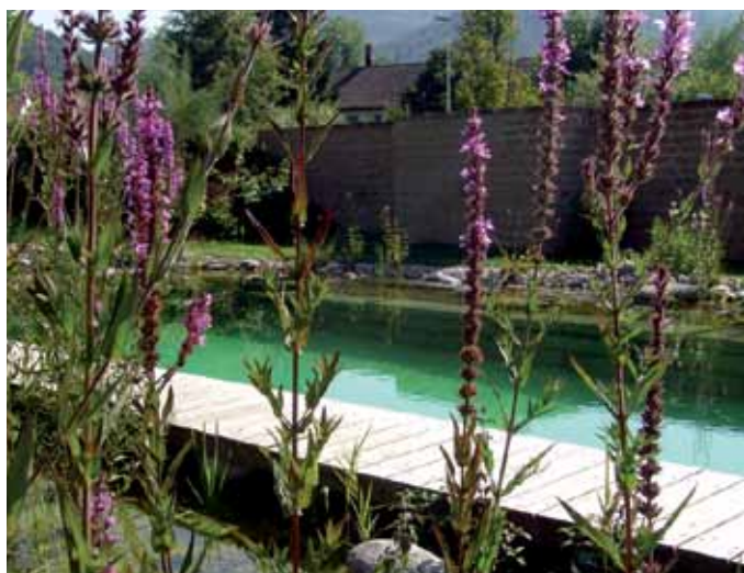
Verspricht prickelnde Kühle an heißen Sommertagen: der Naturpool.