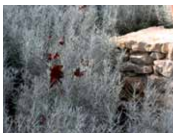
Currykraut Helichrysum italicum

In den Ländern zwischen Griechenland und Portugal geht die Liebe zum Garten sprichwörtlich durch den Magen.