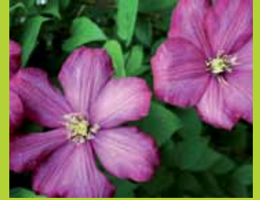
... Pflanzen mit südlichem Flair, die auch in unseren Breiten wachsen.