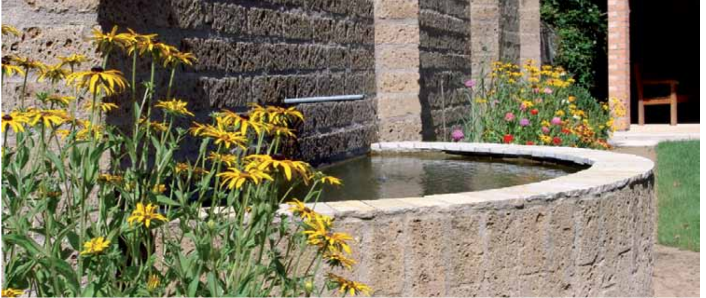
Wasserbecken haben einen festen Platz in Mittelmeergärten.