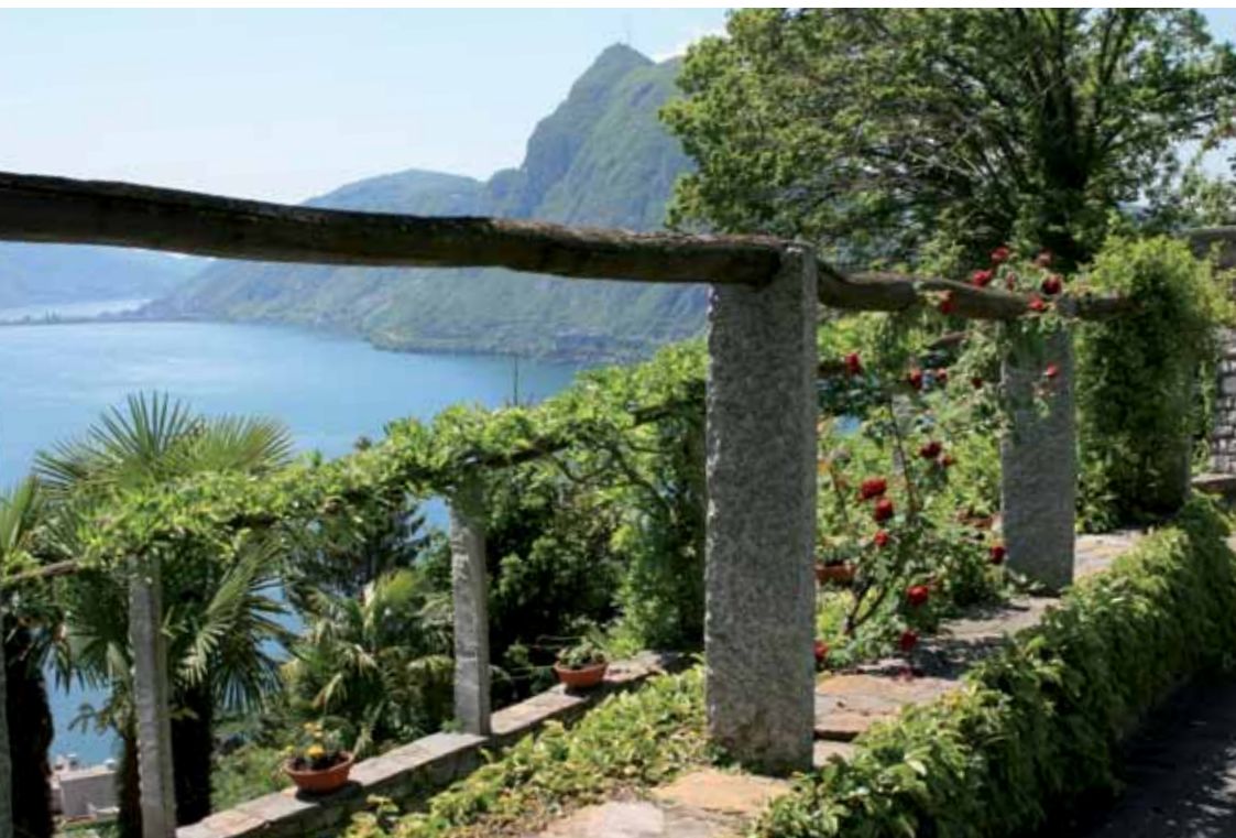
Das perfekte Gerüst für Kletterrosen, Glyzinien oder Weinreben ist die Tessiner Pergola.

Mauern wider. Ganz oben auf der Liste der geeigneten Materialien steht der gebrochene, formwild verlegte Naturstein. Sein natürlicher Charme harmonisiert perfekt mit dem rustikalen Flair des mediterranen Gartens. Doch auch Terrakotta-Platten, Kunststeine aus Zement, Kies und Schotter können zum Einsatz kommen – wichtig ist jedoch, dass das entsprechende Material auch bei den kühleren Temperaturen nördlich der Alpen bestehen kann.