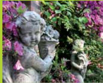
... Statuen, die bereits die Patina der Zeit angesetzt haben ...